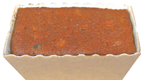
Pain d'épices 70 g