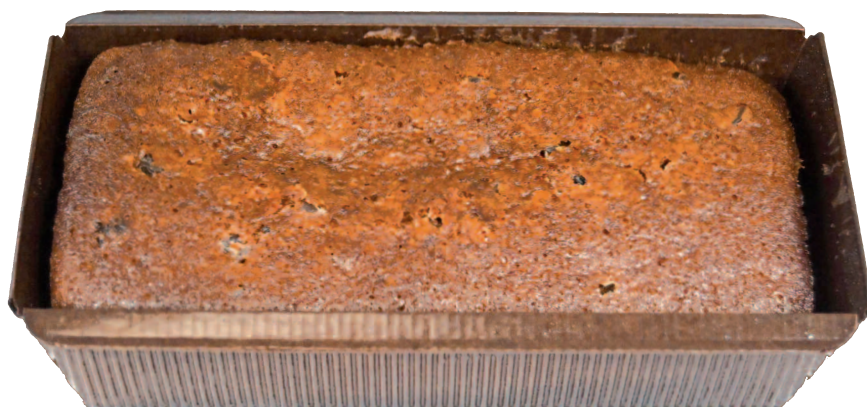
Pain d'épices 225 g

Total pour 152 Pains d'épices : ..... pains à 0,98 € HT l'un, soit un total de ..... € HT Total pour 304 à 456 Pains d'épices : ..... pains à 0,95 € HT l'un, soit un total de ..... € HT Total à partir de 608 Pains d'épices : ..... pains à 0,92 € HT l'un, soit un total de ..... € HT Quantité totale de miel à fournir pour la fabrication des pains d'épices de 70 g : ..... kg